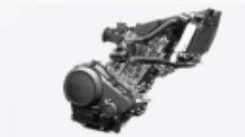
Động cơ 155cc công nghệ VVA Powerful 155cc engine with VVA