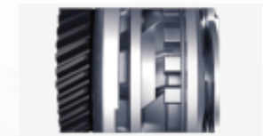
Lý hợp hỗ trợ chống trượt Assist and slipper clutch