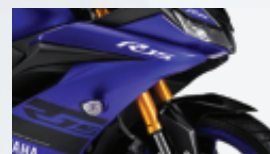
Phụộc trước hành trình ngược Up side down front fork