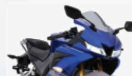
Thiết kế thể thao và khí động học Sporty and aerodynamics design