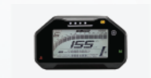
Màn hình LCD đa chức năng Sophisticated LCD instrument